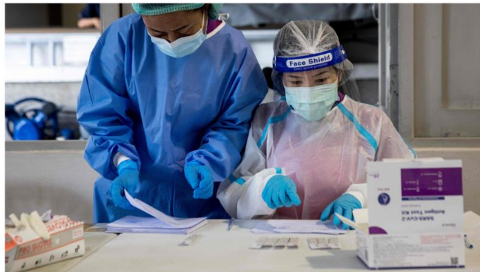
ถึงจุด “พัก” แล้ว ลุ้นโควิดخالง ครม.ผ่านหลักเกณฑ์ ยู เซ็ปพลัสเริ่ม 16 มี.ค.

เว็บไซต์ : https://www.thairath.co.th/news/local/2336211